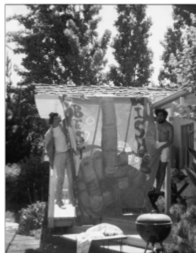
Năzbătia de la școală, cu bannerul „SWAB JOB”