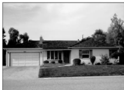
Casa din Los Altos și garajul în care s-a născut Apple